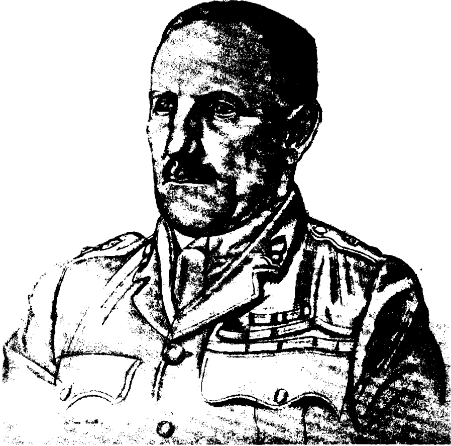
الكولونيل ستيوارت فرانسيس نيوكومب

إلا أنّ الظلام أخذ يسبل ستائره رويداً رويداً ويضمّنا. وعلمنا أنّهُ من المحتوم علينا أن نتجلد تلك الليلة ونجتهد أن ننعم بالكرى. فربما يقتنع التُّرك بأننا ركبنا الليل وبعدنا من هذا المكان إذا رأوا المكان خالياً فأشعلنا النار في حفرة عميقة وتمكنا من محل مريح وخبزنا وتعشينا. وقد علم الجميع بأنه لم تبق لدينا سوى فكرة واحدة وعمل واحد. وأخجل الطّيش على قمة الجبل كلّ أفراد الرّكب وأقمنا «زعل» رئيساً علينا باتفاق جميع الآراء.