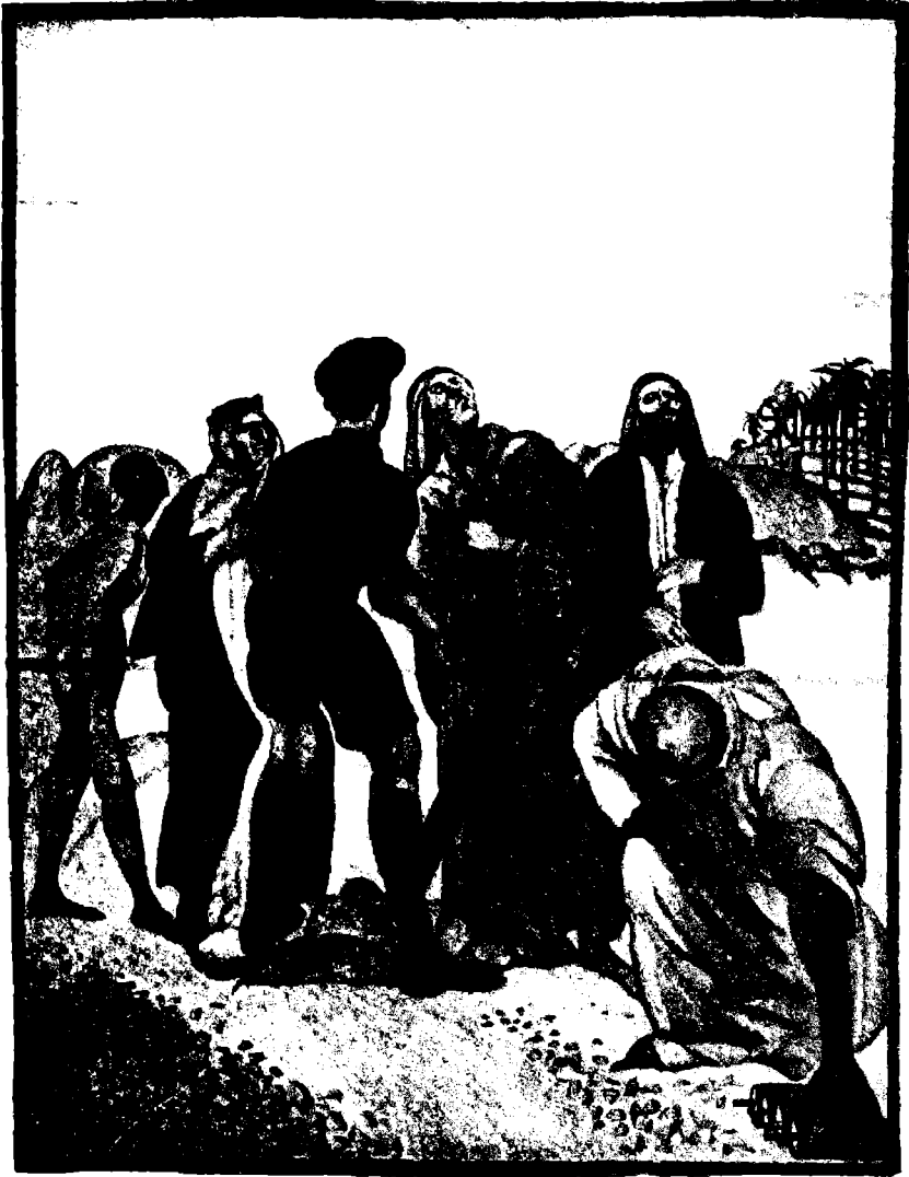
From a drawing by Cosmo Clark

فصیل مدفعیة ستوكس فی العقبۃ عن رسم بریسة كوزمو كلارك