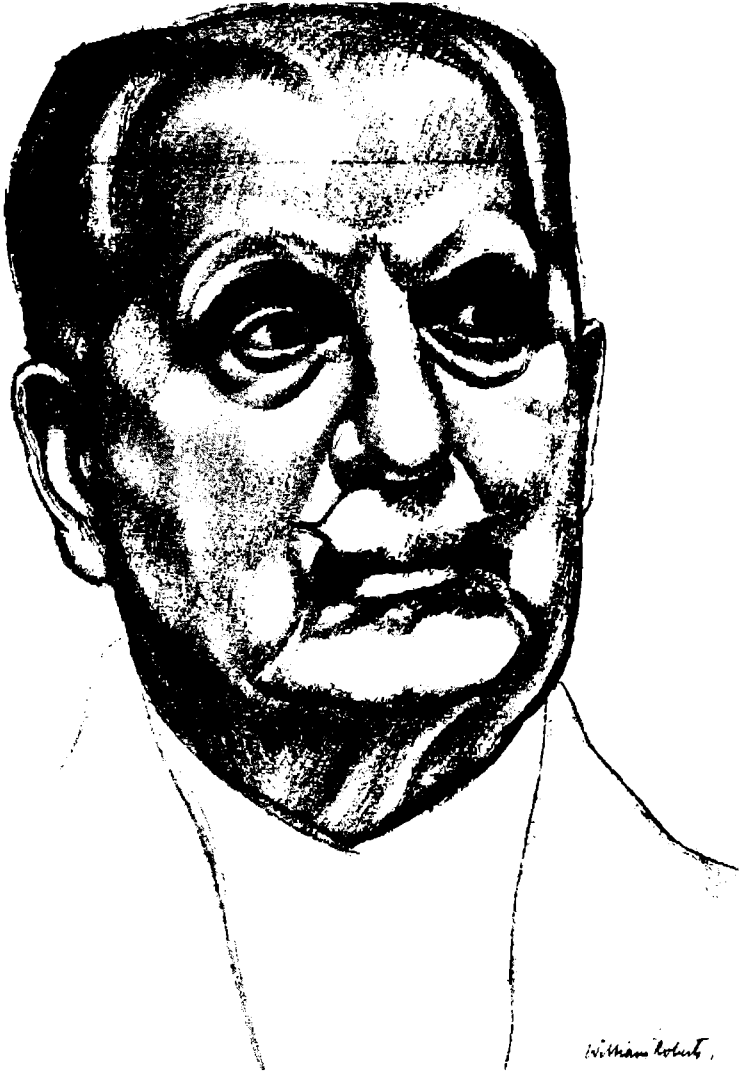
الجنرال سير ريفينالد وينغايث قائد الجيش والمندوب السامي البريطاني في مصر