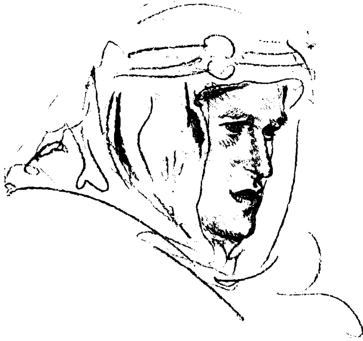
توماس إدوارد لورنس