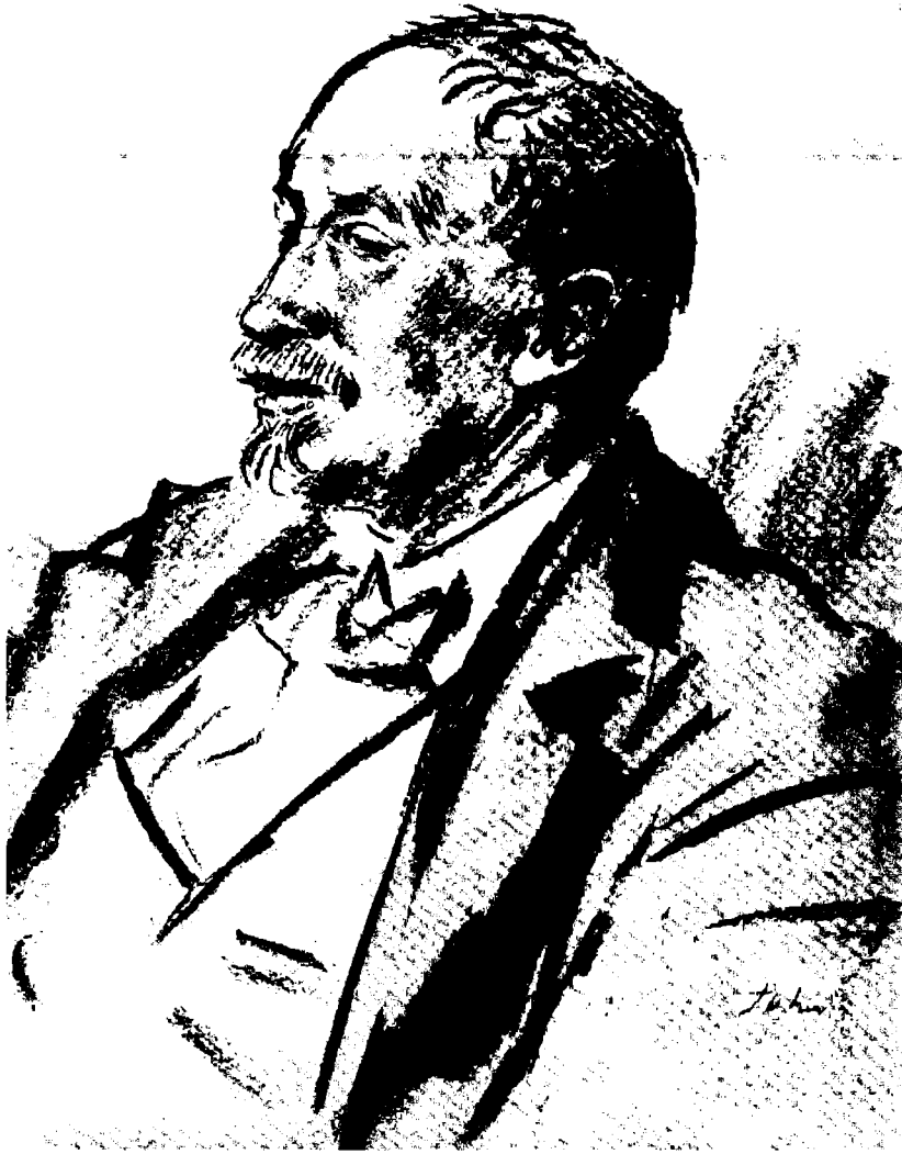
دافيد جورج هوغارث