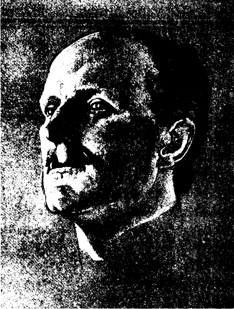
السير رونالد ستورز حاكم القدس، حاكم قبرص

بحرارة الشمس، وأعلام الحرس الأمامي تنعكس بألوانها القرمزية على صفحة الماء الفيروزية، وسار هذا الجيش بخطى منتظمة واسعة ستة أميال في الساعة. فبلغوا القمم وتخطوها، ولم يطلقوا عياراً نارياً واحداً، فأيقنا عندئذٍ بأن الأسطول ورجاله الذين نزلوا إلى البر، قد قاموا بالعمل المطلوب وكفونا مؤونة القتال.