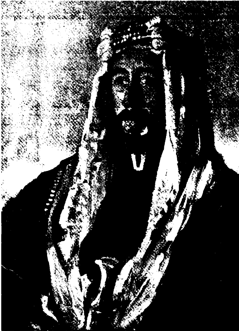
صاحب الجلالة الملك فيصل عاهل العراق

واستأذنت فيصلاً. وسافر «جويس» إلى مصر ووعدنا الشّريف بالتقدم إلى الأزرق مع «مارشال» والالتحاق بي يوم 12 من شهر سبتمبر على الأكثر. فتهلل كل المعسكر عندما رأني أركب «الزّولز»، ووجهتي الشّمال. ورغم أنّنا قد تأخرنا إلى تاريخ 4 من شهر سبتمبر فإنني أمّلت أن ألتحق بالزّولة الذين تحت قيادة نوري الشّعلان فيتمكّنوا من مشاركتنا في الهجوم على «درعا».