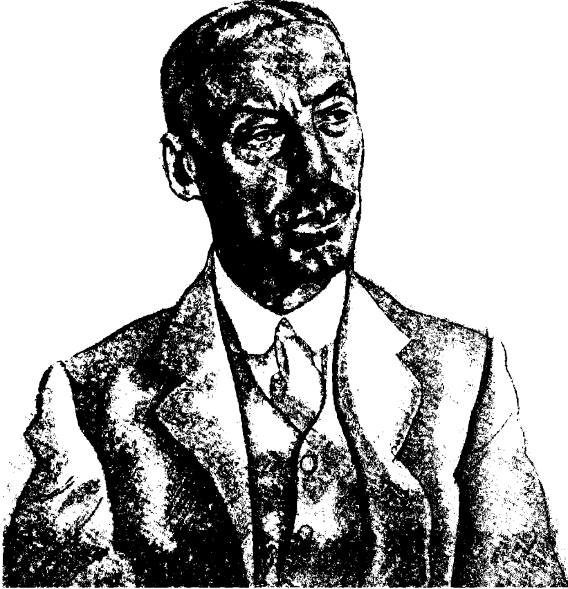
السير هنري مكماهون المندوب السامي في مصر